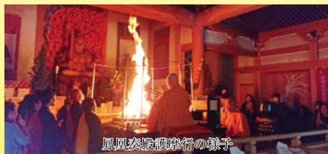
鳳凰奏殿護摩行の様子